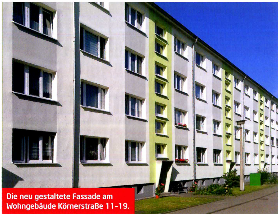
Die neu gestaltete Fassade am Wohngebäude Körnerstraße 11-19.

Stoßlüften am besten mit Durchzug für fünf bis zehn Minuten ist am effektivsten und spart Heizenergie. Lüften Sie mehrmals täglich! Die Raumfeuchtigkeit steigt beim Baden/Duschen oder Kochen stark an. Halten Sie die Türen geschlossen und lüften Sie spätestens, wenn Sie fertig sind.